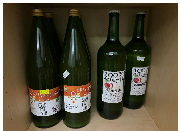
Apfelsaft Streuobst / Naturtrüb