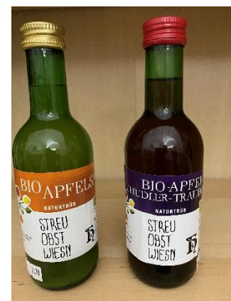
Apfel / Holunder Traube