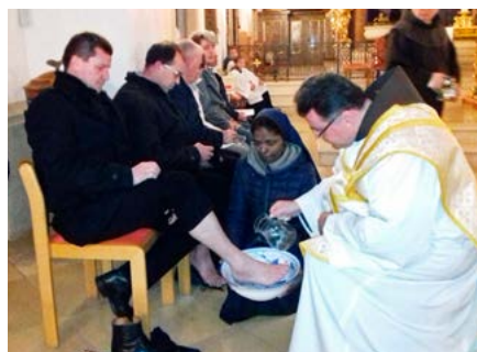
Fußwaschung am Gründonnerstag