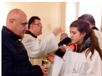
Kommunion in beiderlei Gestalten