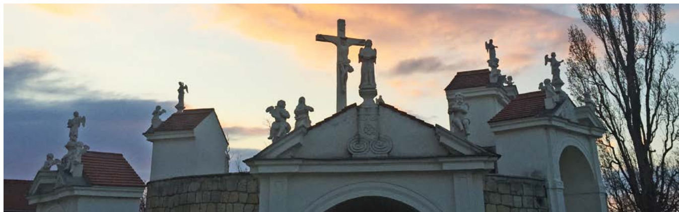
Kalvarienberg am Ostersonntag