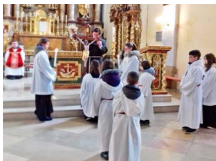
Kreuzverehrung am Karfreitag