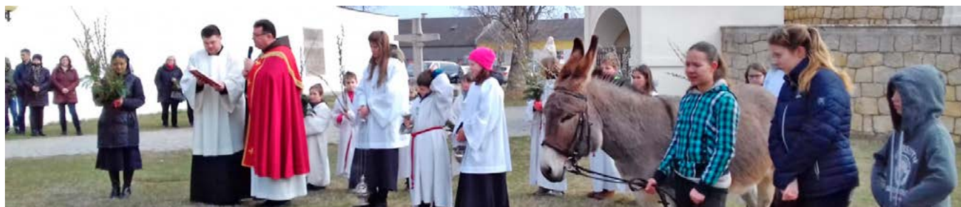
Palmweihe vor dem Kalvarienberg