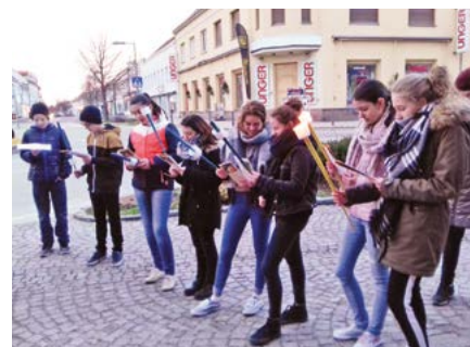
Stadtkreuzweg der Jugend