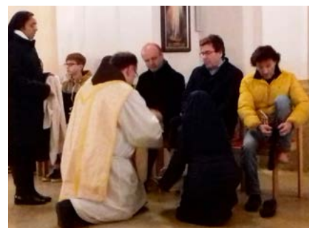
Fußwaschung am Gründonnerstag